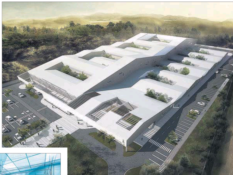
Hospital de Machala y, abajo, el de Puyo, ambos en Ecuador y realizados por PMMT.

La calidad del aire interior de un edificio puede alterar tanto la salud física como mental de sus ocupantes. A ello contribuye la composición de los materiales que nos rodean. Ya existían certificaciones sobre el uso de sustancias químicas en la construcción.